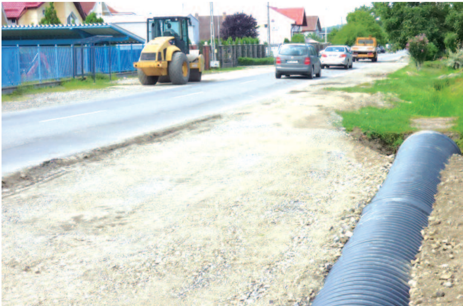
Elkezdtek a buszmegállók kialakítását, közben azon vannak, hogy távolsági buszjáratot kapjanak